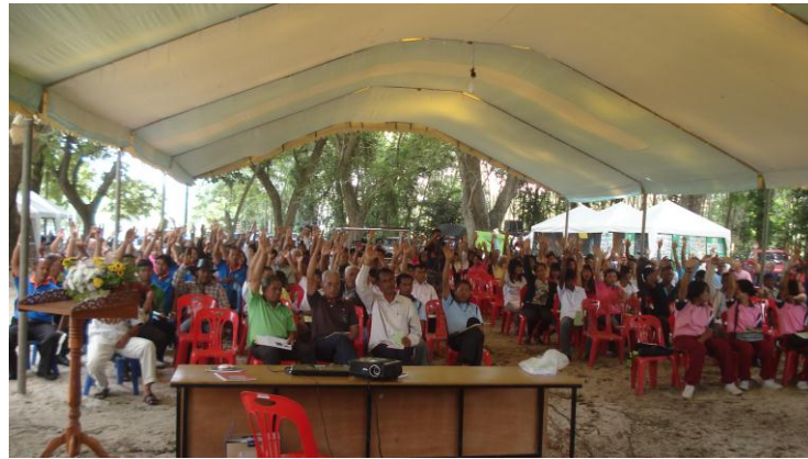
ภาพประกอบที่ 3 เวทีประชาพิจารณ์ธรรมนูญลุ่มน้ำคลองภูมิ

6. ความเป็นพื้นที่สาธารณะและเชิงประเด็นพลเมือง (Publicity and Civil Issues) “พื้นที่สาธารณะ” เพื่อการมีส่วนร่วมในการร่วมแสดงความคิดเห็น การแสดงความห่วงใยที่มีต่อ “ประเด็นปัญหา” ในพื้นที่โดยมีการแสดงการเคลื่อนไหวในรูปภาคประชาสังคม เช่น การวิพากษ์วิจารณ์ การรับฟังความคิดเห็น การร่วมทำประชาพิจารณ์ การประชุมกลุ่มย่อย โดยการเคลื่อนไหวเหล่านี้สามารถกระทำได้อย่างอิสระตามระบอบประชาธิปไตยในการร่วมรับรู้ ตระหนักต่อปัญหาของพื้นที่สาธารณะในการใช้ทรัพยากร ดิน น้ำ ป่า ฐานทรัพยากรแห่งชีวิต ทรัพยากรสาธารณะร่วมภายใต้สิทธิชุมชน สิทธิพลเมือง ชุมชนพื้นที่เกิดกลไกในการพัฒนางานพื้นที่ขึ้น